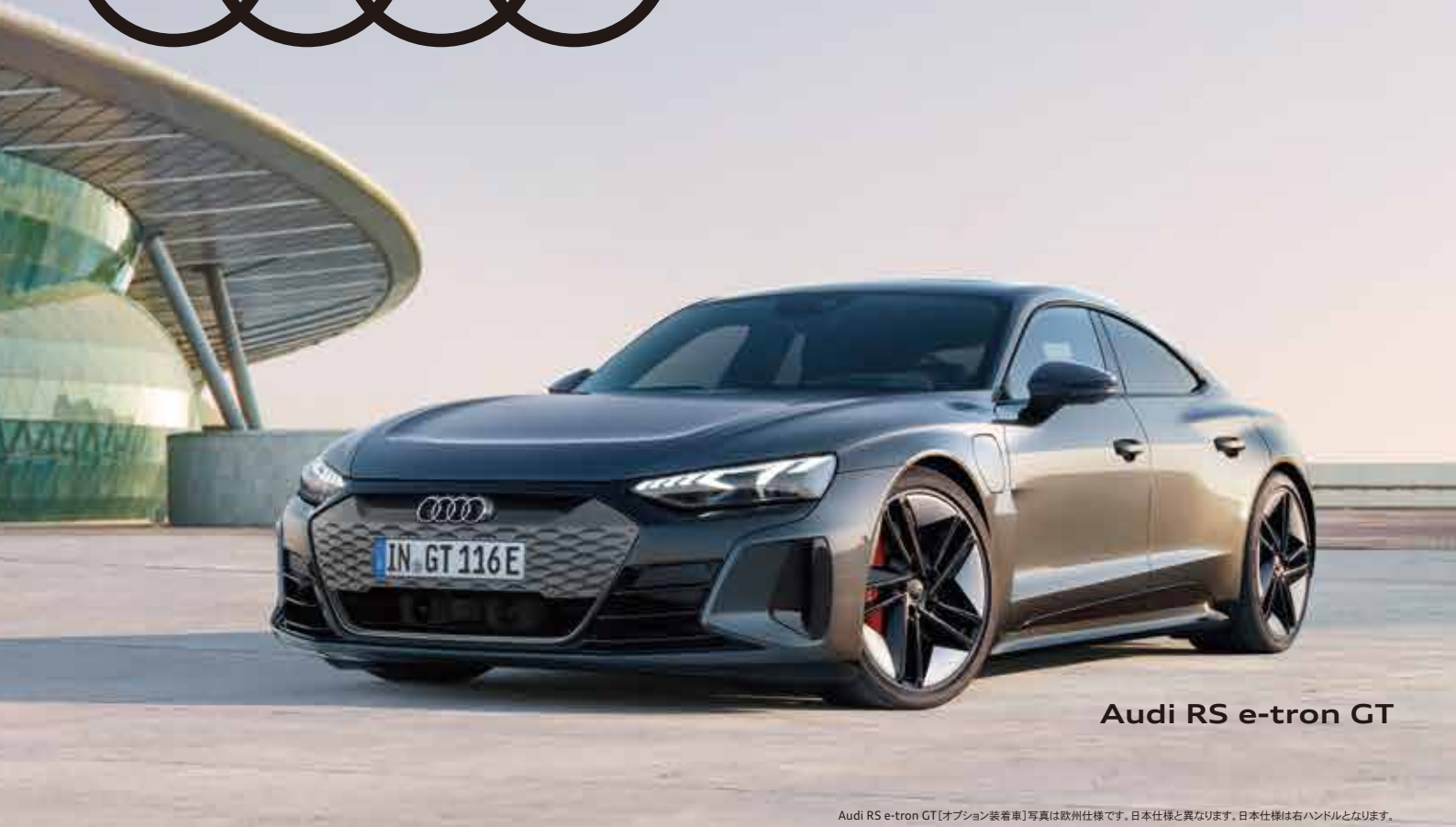
Audi RS e-tron GT

Audi RS e-tron GT [オプション装着車] 写真は欧州仕様です。日本仕様と異なります。日本仕様は右ハンドルとなります。