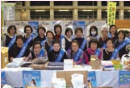
女性部会役員の皆様