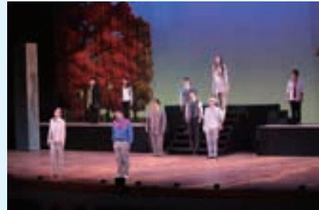
ミュージカル風景

峡田地区小学校の5・6年生、約700名を招待して、タックスミュージカル2014「命の輝き」を公演しました。ミュージカルを通じて、未来を担う児童たちに納税の必要性について理解してもらおう場として開催しています。